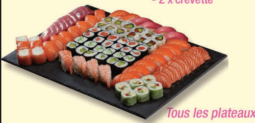
Tous les plateaux sont servis avec une bouteille de boisson soft (...cl)

PLATEAU 1 Fresh rolls - 6 x cheese Makis - 6 x crevette - 6 x avocat, cheese, mangue Spring rolls - 6 x saumon, avocat Sashimis - 3 x saumon Sushis - 3 x thon - 3 x saumon PLATEAU 2 California rolls - 6 x saumon, cheese - 6 x saumon, avocat - 6 x poulet, avocat Fresh rolls - 6 x saumon, cheese Makis - 6 x saumon - 6 x concombre, cheese Spring rolls - 6 x thon cuit, avocat Sushis - 2 x thon - 2 x saumon - 2 x tamago - 2 x crevette PLATEAU 3 California rolls - 6 x saumon, cheese - 6 x crispy oignon, saumon, cheese Spring rolls - 6 x saumon, avocat Makis - 6 x avocat, cheese - 6 x saumon - 6 x thon Sashimis - 3 x saumon - 3 x thon Sushis - 3 x saumon - 3 x thon Soja rolls - 6 x poulet mayonnaise, avocat Fresh rolls - 6 x cheese, avocat PLATEAU 4 California rolls - 6 x poulet, avocat - 6 x crevette, avocat - 6 x saumon, avocat Spring rolls - 6 x concombre, cheese - 6 x thon cuit, avocat Makis - 6 x avocat, cheese - 6 x saumon - 6 x crevette - 6 x thon Sashimis - 4 x saumon - 4 x thon Sushis - 4 x saumon - 4 x daurade - 4 x thon - 2 x crevette - 2 x Saint-Jacques